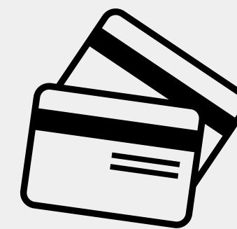
Débito o crédito

Usted puede cancelar el arancel del diplomado a través de sistema de 5 cuotas, precio contado. Lo anterior corresponde a la suma de 5 cuotas de $109.500 mediante transferencia bancaria, los 5 primeros días de cada mes